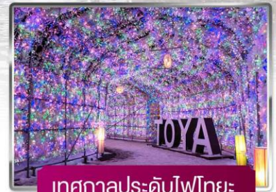
เทศกาลประดับไฟไทยะ